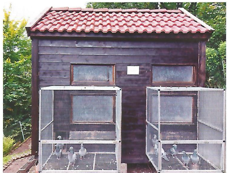
Ein Zuchtschlag darf auch nicht fehlen.